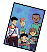
Les troubles du spectre de l'autisme HORS CASES Paul Cohen

fr/?Jclid=IwAR1dWTsjQvnkJiJECCyScGCmClssfdxUutA3L3RHv8WNgxbt5vJZbP2eOY